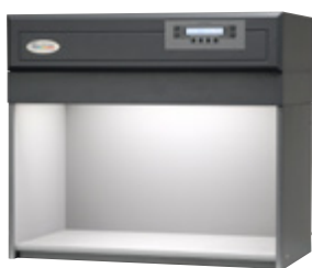
Farbmusterungskabine ausgestattet mit Diffusor